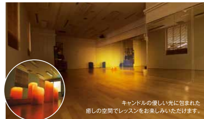
キャンドルの優しい光に包まれた癒しの空間でレッスンをお楽しみいただけます。

レッスンに合わせて照明やキャンドルなどで雰囲気を変え、よりレッスンをリラックスしながら満喫できるスタジオです。