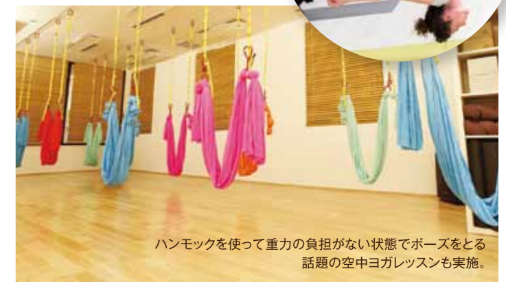
ハンモックを使って重力の負担がない状態でポーズをとる話題の空中ヨガレッスンも実施。