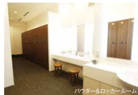
パウダー＆ロッカールーム

ライティングにもこだわったパウダールームを完備し、お化粧直しやヘアセットも快適にご利用いただけます。